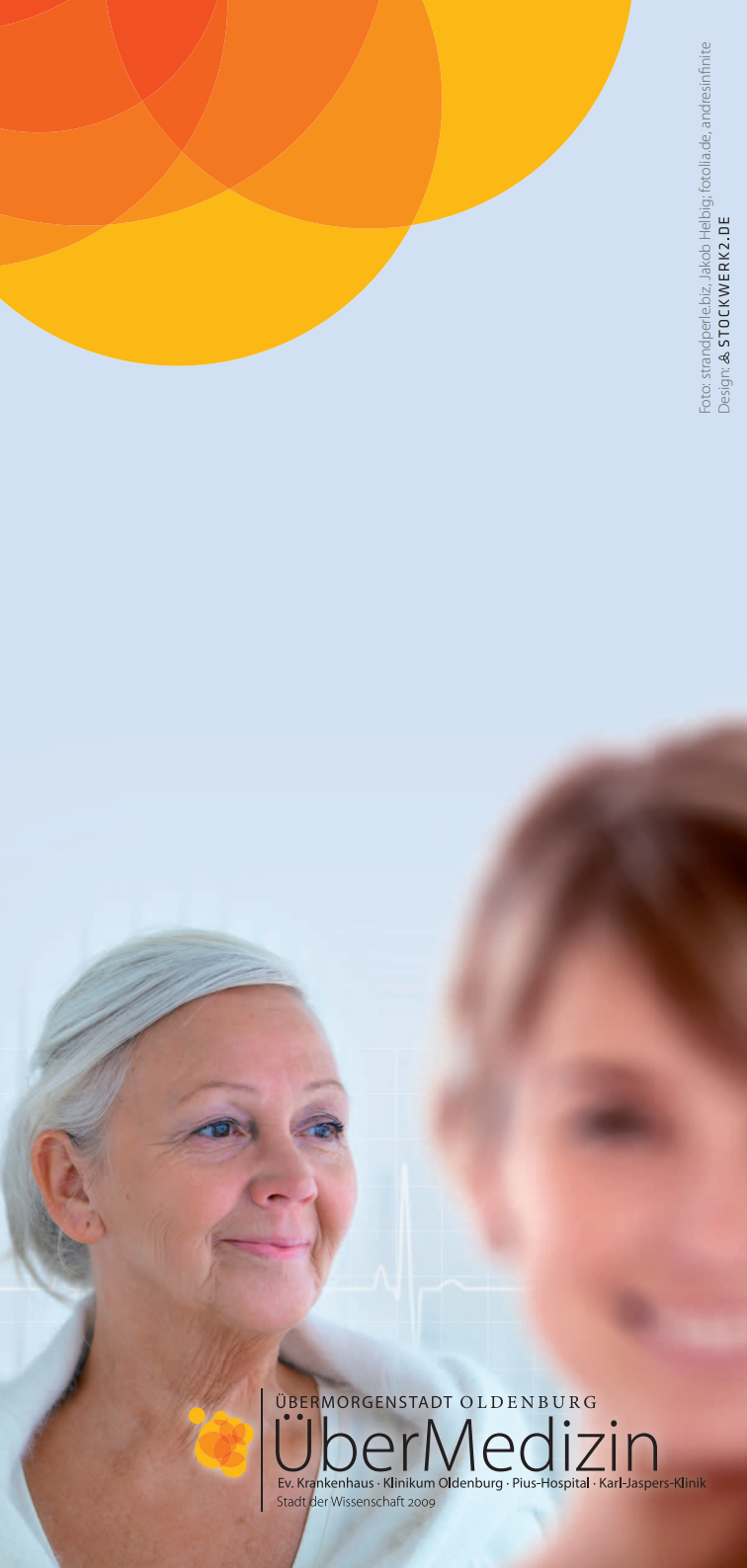
Design: & STOCKWERK2.DE